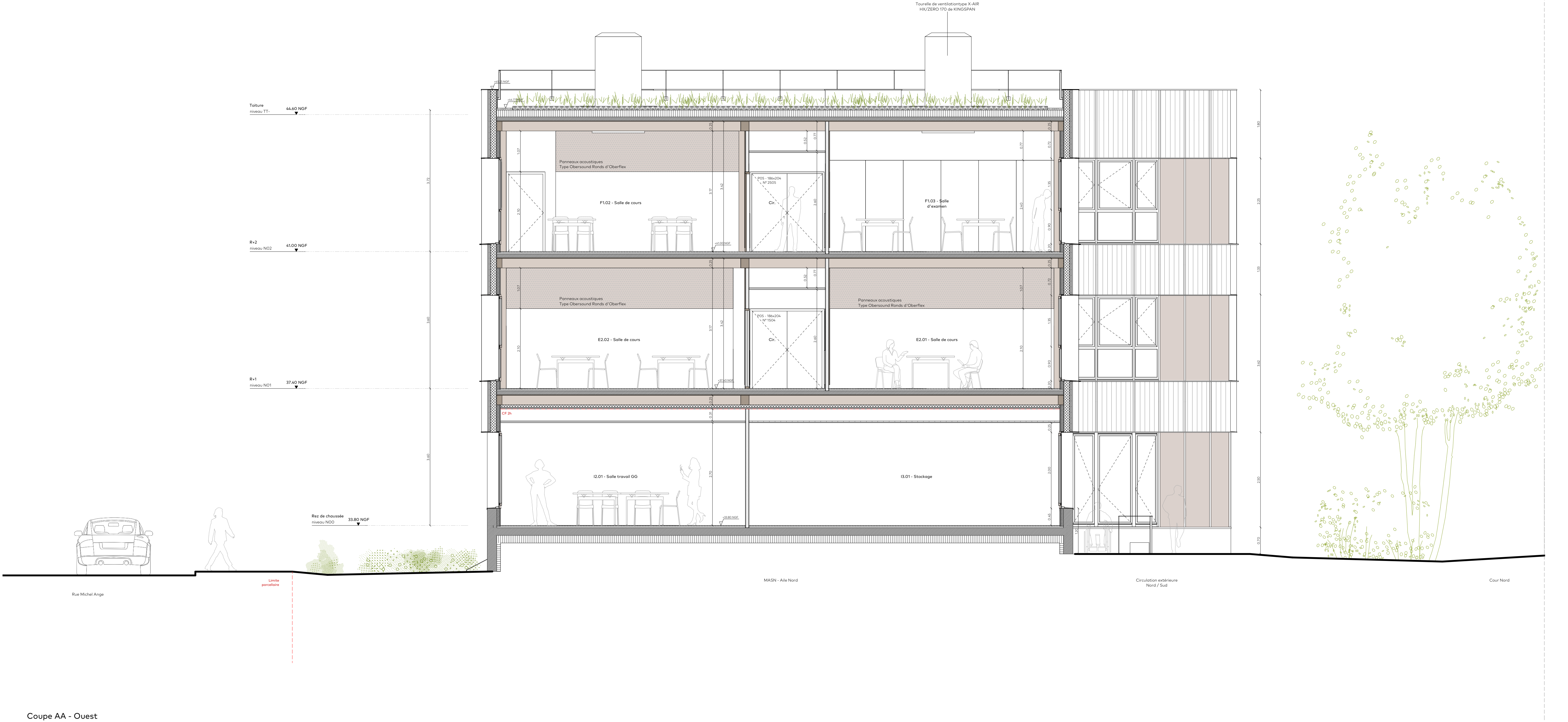
Coupe AA - Ouest